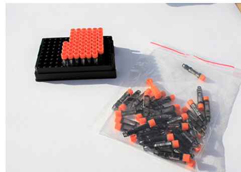
Innsending av prøverørene i en lynlåsepose