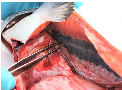
Nyre (ta prøve av hodenyre (fremre del))