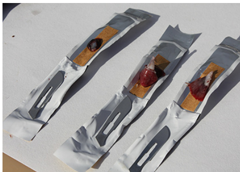
Trimming av vev på skalpellemballasjen