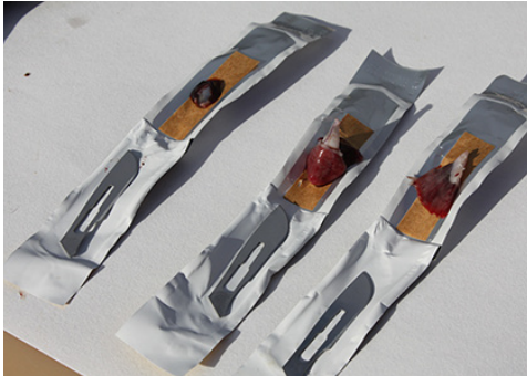
Trimming av vev på skalpellemballasjen