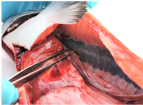
Nyre (ta prøve av hodenyre (fremre del))