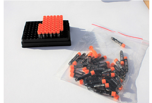
Innsending av prøverørene i en lynlåsepose